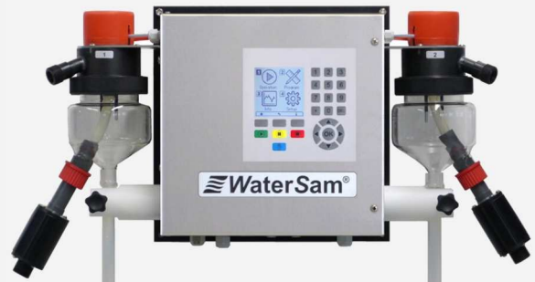
WS 98 mit zwei Probenahmesystemen (FMWW)